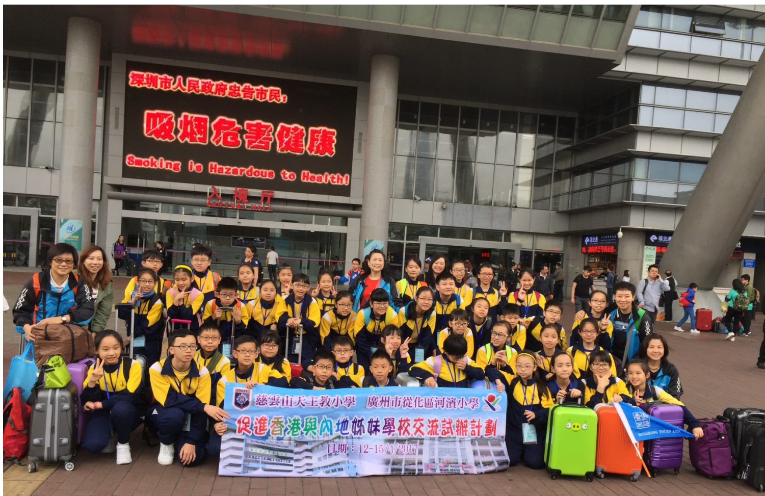
阮校長、黃副校長、5位主任及 40位同學探訪從化姊妹學校